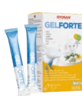
Gel do krku