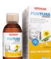
Sirup do krku