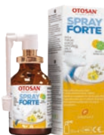
Sprej do krku